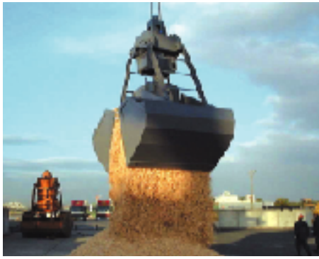
15㎡ チップ荷役(ショックレス機能付)