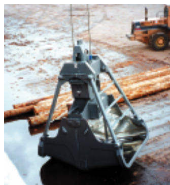
ニッケル用 8㎡ SUS内張り